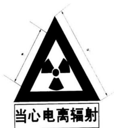
图 F2 电离辐射警告标志

电离辐射的警告标志如图 F2 所示。警告标志的含义是使人们注意可能发生的危险。其背景为黄色，正三角形边框及电离辐射标志图形均为黑色，“当心电离辐射”用黑色粗等线体字。正三角形外边 a_1=0.034L ，内边 a_2=0.700a_1 ， L 为观察距离。